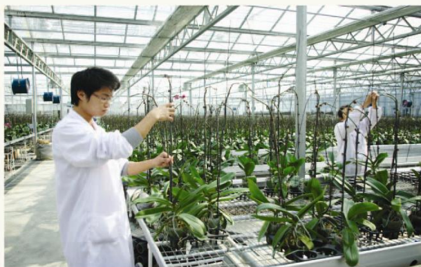
大浦驯化中心内的蝴蝶兰已经含苞待放,据技术人员介绍,元旦前后,蝴蝶兰将大面积开花,投入市场。图为技术人员正在为蝴蝶兰塑形。

“专业化、规范化、国际化”为特色,以“起点更高、立意更新、品牌更响、影响更大”为目标,充分反映科普产业的发展现状,展示国内外科普产品及技术的最新成果。大浦试验区作为省级现代农业科技示范园区,发挥着研发成果、孵化产品和关键技术集成的作用,在建设过程中,试验区以高新科技为引领,把握农业现代化这个核心,把一产的传统农业打造成以低碳、循环、高科技为显著标志的现代农业,并向二产、三产延伸发展,取得了显著的发展成效。新农村集团展位所展出的现代农业成果在展会上受到了广泛关注。