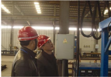
▲ 评审组专家深入生产车间进行安全生产检查

本报讯(通讯员 朱宗华) 11月28日上午,安徽鲁班钢构有限公司安全生产标准化三级达标评审会在钢构公司会议