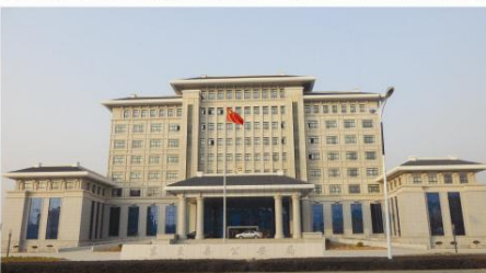
▲黄山杯工程——东至县公安局110指挥中心综合楼工程