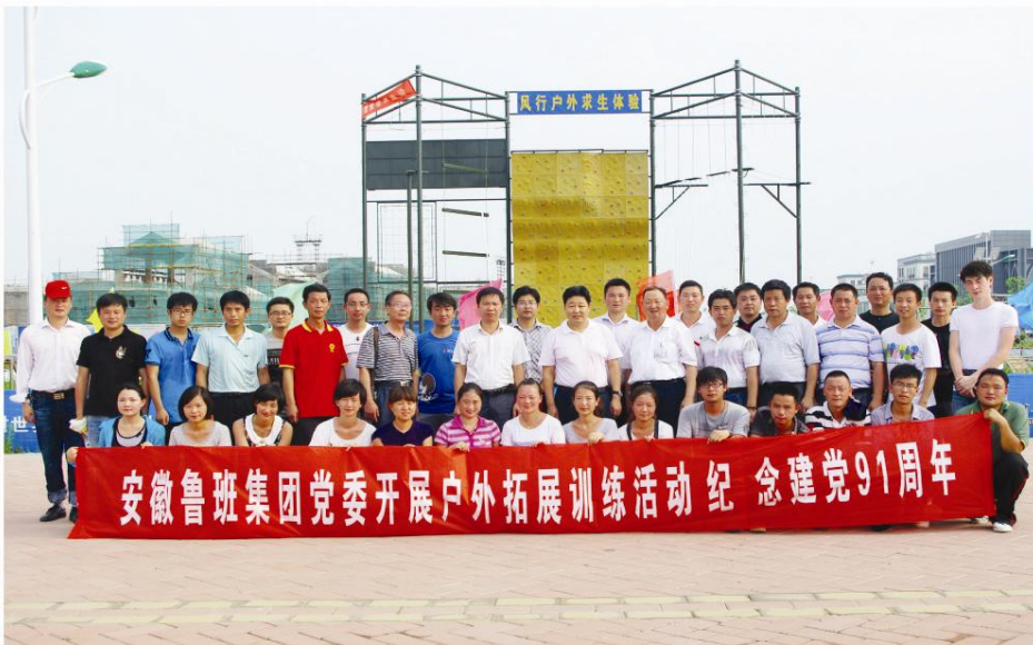
▲ 全体党员合影留念