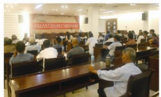
▲ 第二期新型农民培训班

为做好新型农民培训工作,新农村集团高度重视,专门成立了培训领导小组,派专人精心安排课程相关事宜,严格挑选培训教师,并对培训内容严格把关,以确保培训效果最大化,让受训农民听得明白、学得全、用得上,真正使农民将理论运用到实际操作中,提高农民的专业技能。