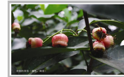
丰收的果实

在这个奋斗艰辛的过程中,就像是一种海选,突出的,那就是所谓的生活中的强者,有强者的同时也一样演变着生活的弱者。有道是“强者容易坚强,弱者容易软弱。”一个真的有能力的人能在社会风暴中更显坚强;而弱者在同样的环境中只会更显软弱。人的一生,生活就像一杯美酒,没有三番五次的提炼,是不会有这么可口的。我相信大家在小学的时候,课文中有一篇《小蝌蚪找妈妈》,小蝌蚪它们依靠的就是自己的坚持,坚强的意志,最