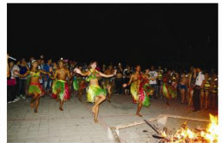
▲ 民族舞者在篝火晚会中的精彩演出

本报讯(通讯员 王政) 又到农历七夕节,我国传统节日中最具浪漫色彩的节日,2012年的这一天注定要与与众不同。8月23日,大浦乡村世界景区海啸夜场主题派对——“七夕浪漫夜,疯狂海啸情”正式拉开帷幕,数百对情侣欢聚大浦乡村世界,并在“浪漫七夕节”牵手这片温馨的“爱情海”,在中华传统节日“七夕”定情大浦浪漫海滩。