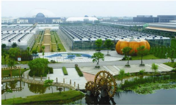
▲ 大浦现代农业科技园区

优质水稻、健康水产、高效园艺三大产业的发展大力的推动了安徽芜湖农业科技园区的建设,一个崭新的国家农业科技园区正在加速形成。