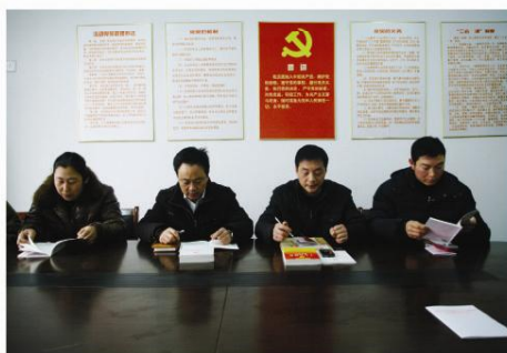
▲ 神牛党支部深入学习十八大，将十八大精神落实到加大自主产品出口的具体实践中