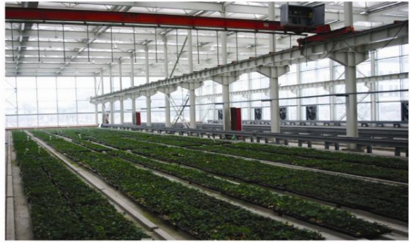
▲ 大浦现代农业自动化育苗生产中心内