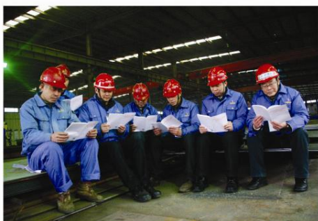
▲ 钢构党支部利用生产间隙，认真学习十八大报告