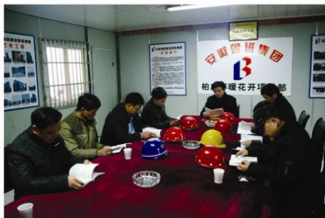
▲ 铜陵党支部落实十八大报告精神，以建立农民工工资支付打卡制度为着力点，保障农民工权益