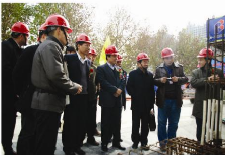
▲ 出席仪式的领导参观浙商大厦工程施工现场