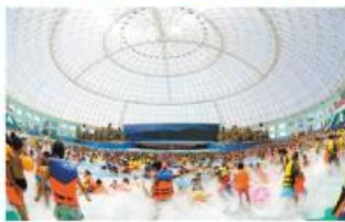
▲游人在大浦乡村世界体验“海嘴”瓜。

几年前,大浦乡村世界所在地方还是破旧的村庄,后来,在政府的推动下,投资商决定在此开发新农村建设,通过将一产的传统农业向二产和三产延伸发展,同时大力发展科技、低碳、循环农业,实现现代农业、工业、文化产业、旅游业的深度融合。