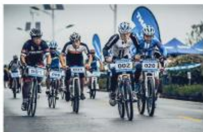
▲争先恐后