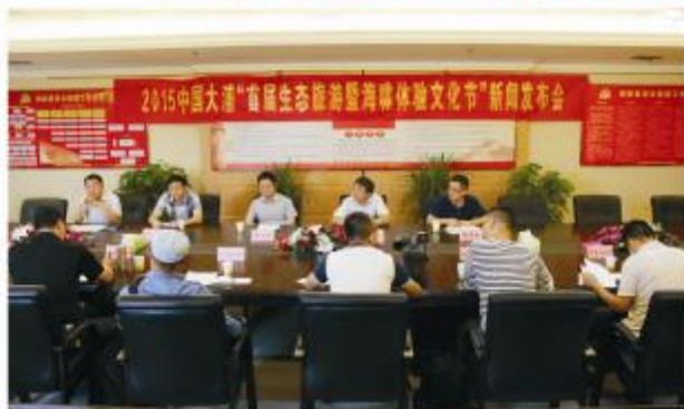
▲6月16日，“首届生态旅游暨海啸体验文化节”新闻发布会召开