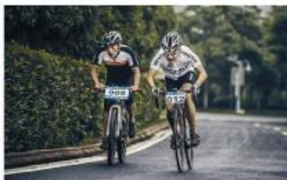
▲你追我赶