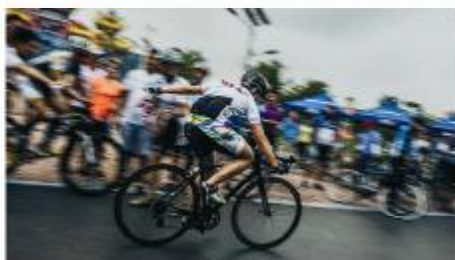
▲风驰电掣