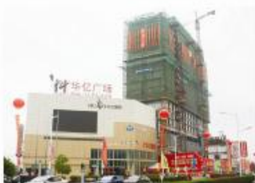
▲“繁昌华亿广场”项目现场

主体楼高21层。该项目2014年4月18日正式开工,项目部在施工管理过程中高度重视安全质量,严格遵循施工时间节点控制,在要求时间内主体大楼顺利封顶,即将进入墙体砌筑阶段。该工程预计在今年年底竣工交付使用。