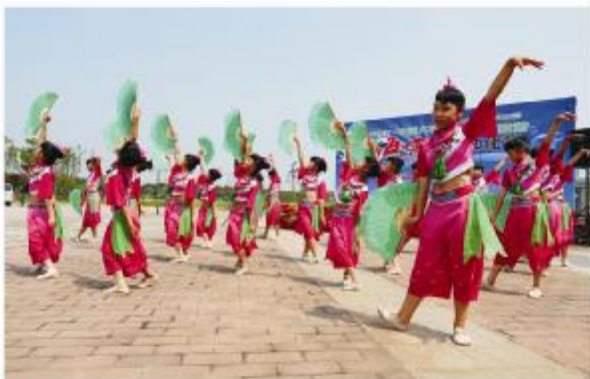
▲文化节开幕式上精彩的歌舞表演

生态旅游暨海啸体验文化节的重头戏当然少不了激情四射的海啸体验。数千人在海啸馆里面对滔天巨浪,尖叫声此起彼伏,用这种独特的方式