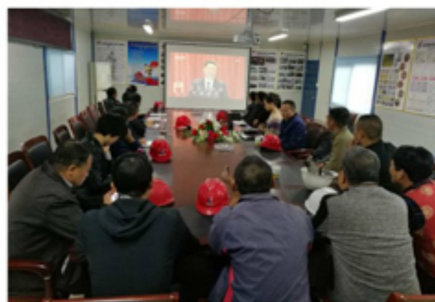
▲芜湖支部收看十九大开幕式