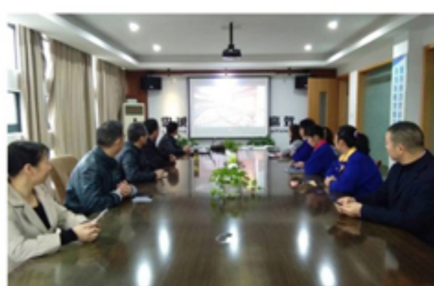
▲神牛支部收看十九大开幕式场景

故的老一辈无产阶级革命家和革命先烈默哀。全体党员仔细聆听了习近平总书记代表第十八届中央委员会向党的十九大所作的报告，站在新的历史起点，感受新的发展阶段。参会人员边听边做学习笔记，深刻感受到在全面建成小康社会决胜阶段、中国特色社会主义发展关键时期召开的十九大，对于实现“两个一百年”奋斗目标、实现中华民族伟大复兴的中国梦，所具有的重大而深远的意义。（黄芹）