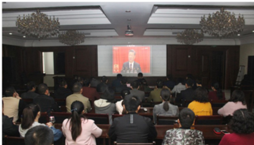
▲集团党委组织党员集中收看十九大开幕式

10月18日上午，集团党委组织全体党员收看中国共产党第十九次全国代表大会开幕盛况。机关支部、新农村支部、建设支部全体党员、入党积极分子于集团总部一号会议室集中观看，芜湖支部、铜陵支部、地产支部、北京支部、钢构支部、神牛支