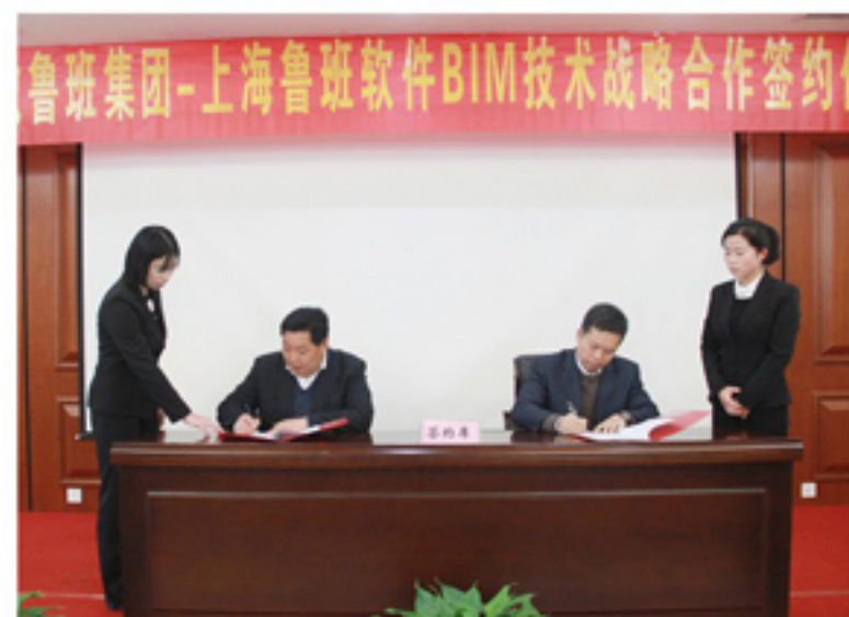
▲BIM技术战略合作签约