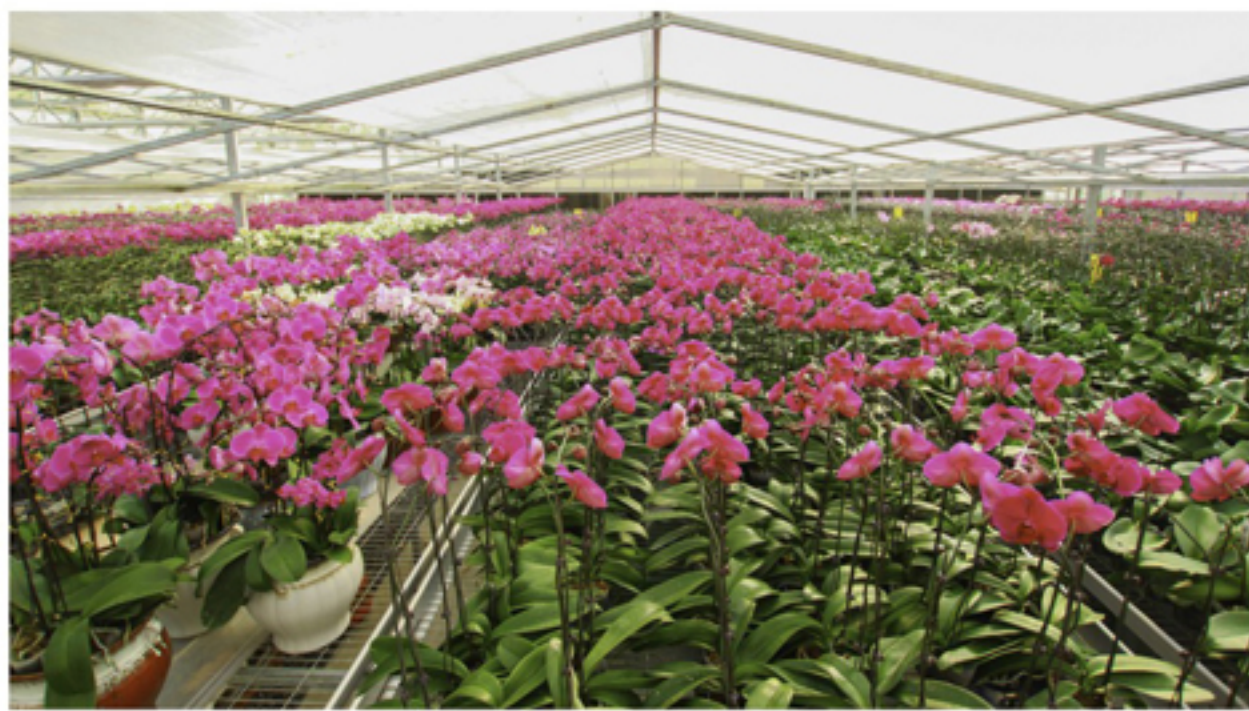
▲驯化中心内，满眼繁花