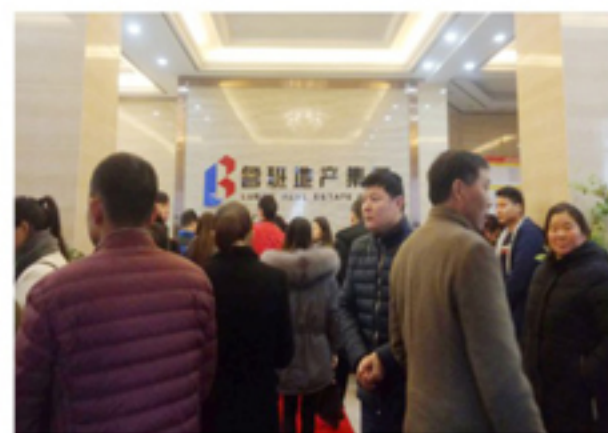
▲开盘现场人头攒动

路，地理位置优越、交通路网发达，规划完善的配套设施让鲁班·金色水岸成为购房者在南陵置业的首选。