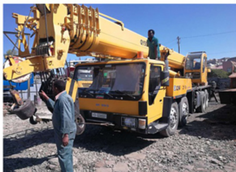
▲集团建筑业务拓展到埃塞俄比亚