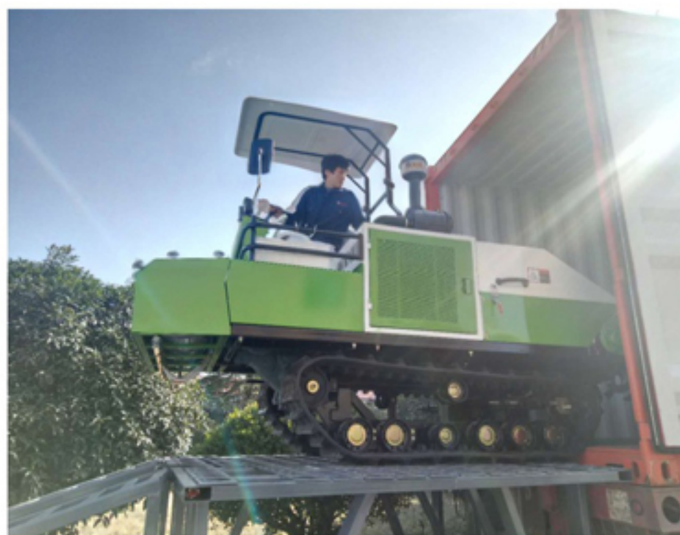
▲旋耕机装上集装箱，即将出口印尼

据神牛公司负责人介绍，这款 IGLZ-180型履带自走式旋耕机在原整机基础上，进行了技术改进升级。此次改造升级主要体现在零部件的品质、外观工艺和结构优化上。根据客户提出的要求，在3整机的前端增加设计了洒水施肥机，后端旋耕机的上端增加设计了播种器升降工作台，使整机具有了施肥、旋耕、播种多种功能。通过结构的改进，不仅提高了的该