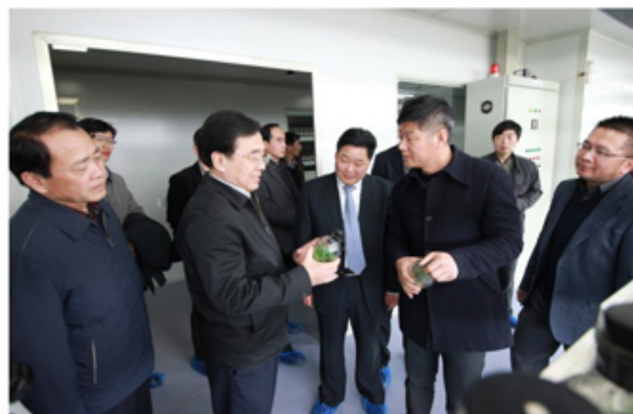
▲省委副书记信长星在大浦组培中心调研

2017年10月26日，中国施工企业管理协会表彰了2017年度工程建设诚信典型企业，公布了2017年度工程建设企业社会信用评价结果。鲁班建设荣获“2017年度工程建设诚信典型企业”称号，同时在工程建设企业社会信用评价年度审核中合格，继续保留原有的AAA级信用等级。