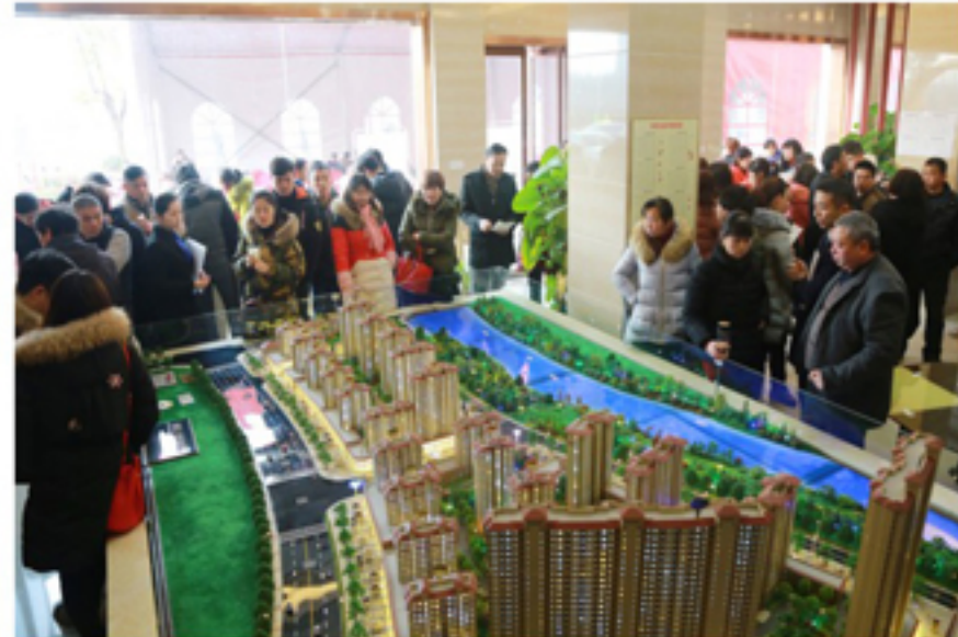
▲鲁班·金色水岸二期开盘现场